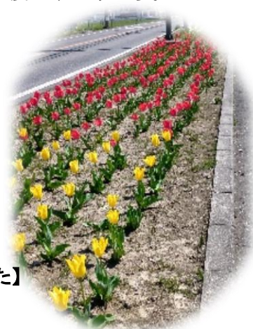
【今年もきれいに咲きました】