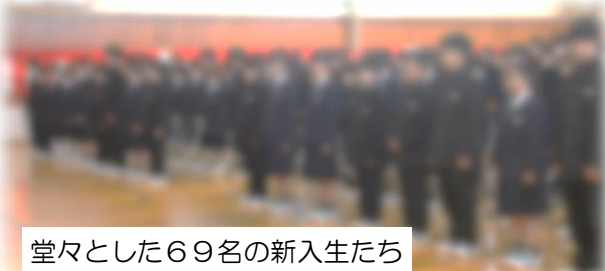
堂々とした69名の新入生たち