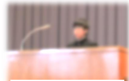
2年生代表 〇〇 〇〇さん

学年としては、学年目標についての取組です。1年生の時の学年目標は、『三超』でした。『三超』とは、「超傾聴」「超協力」「超仲良く」です。1年生の時は、「超協力」と「超仲良く」がとてもよくできていたけれど、「超傾聴」があまりできていませんでした。2年生では、自分も含めて「超傾聴」がちゃんとできるように、傾聴する意識を忘れずに頑張りたいと思います。そして、新入生のお手本になりたいと思います。