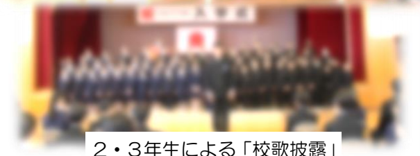
2・3年生による「校歌披露」