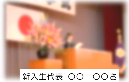
新入生代表 〇〇 〇〇さん

支え合う気持ちを忘れずに、一人一人がこの3年間で成長していくために努力することを誓います。