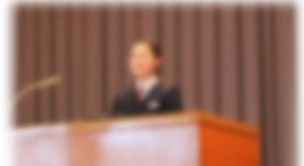
3年生代表 〇〇 〇〇さん