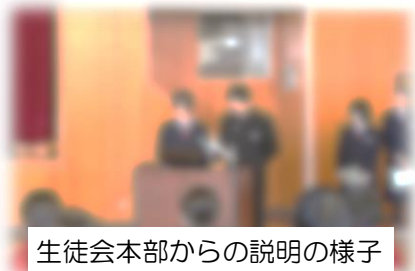
生徒会本部からの説明の様子